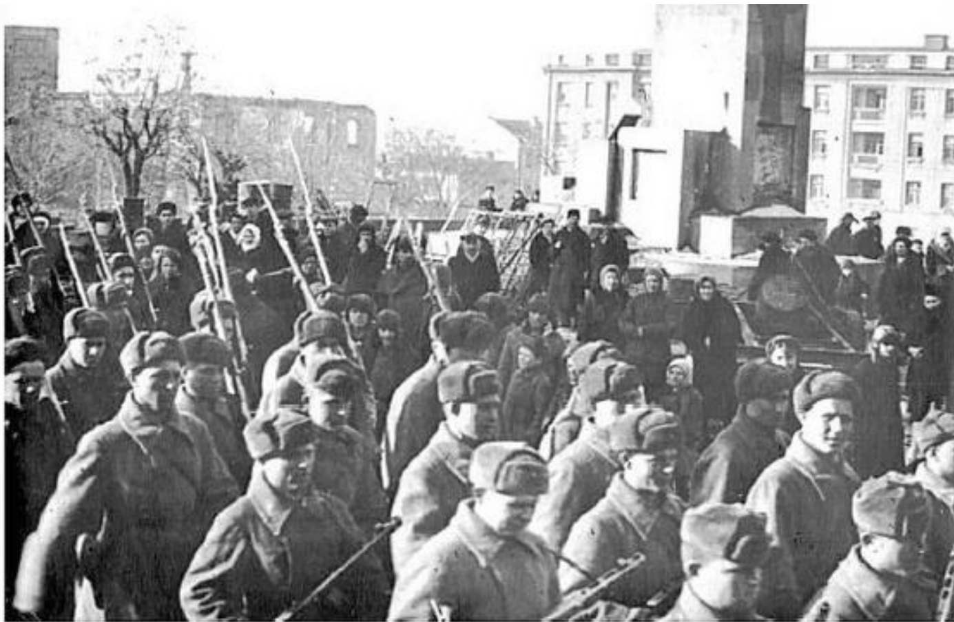
Парад советских войск в освобожденном Ворошиловграде, 1943 г.